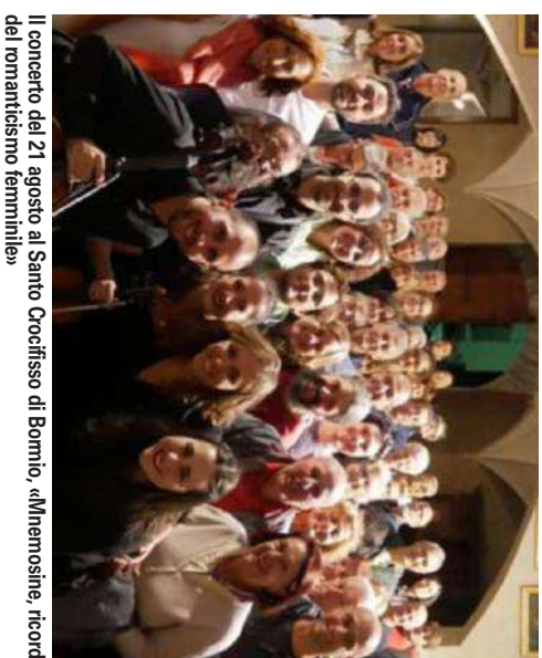
Il concerto del 21 agosto al Santo Crocifisso di Bormio, «Mnemosine, ricordi del romanticismo femminile»