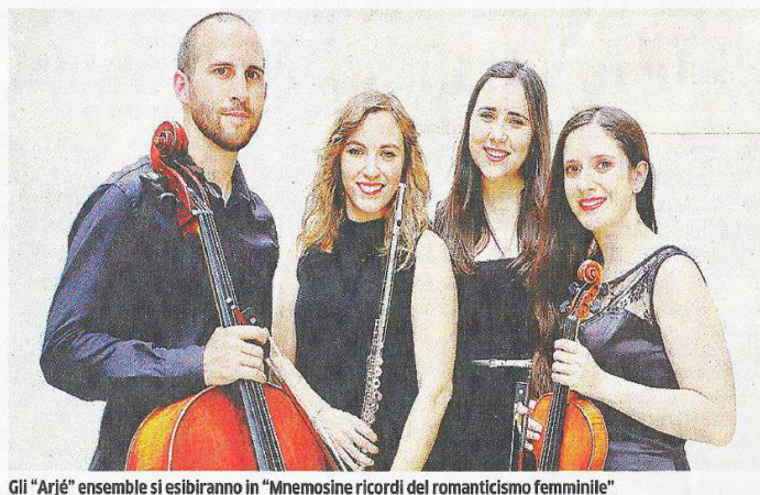
Gli “Arjé” ensemble si esibiranno in “Mnemosine ricordi del romanticismo femminile”