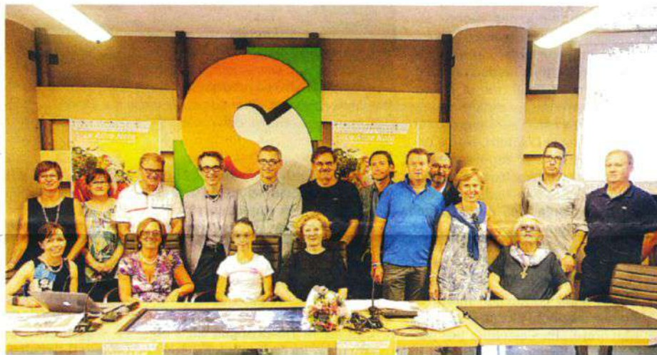
La presentazione del Festival Valtellina "LeAltreNote" nella sala della Comunità montana GIANATTI

Cultura che fa rima con turismo, «toccando i 42 concerti luoghi meravigliosi e unici, che vanno riscoperti sotto altri am-