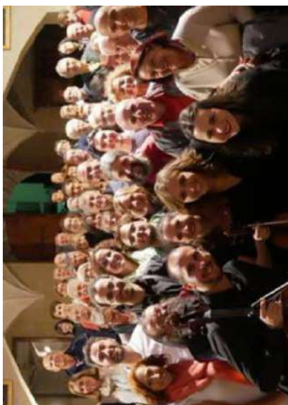
Foto di gruppo dei protagonisti