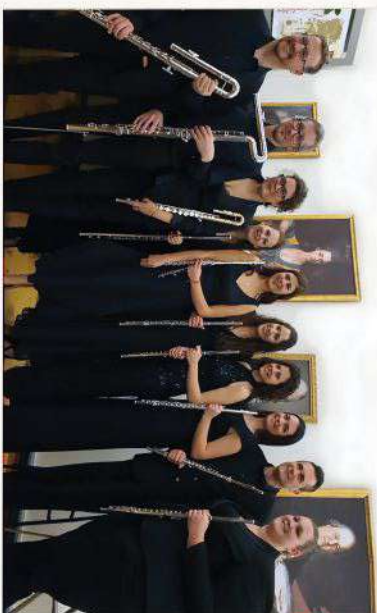
Il Maestrale Flute Ensemble di scena domenica pomeriggio a Lanzada