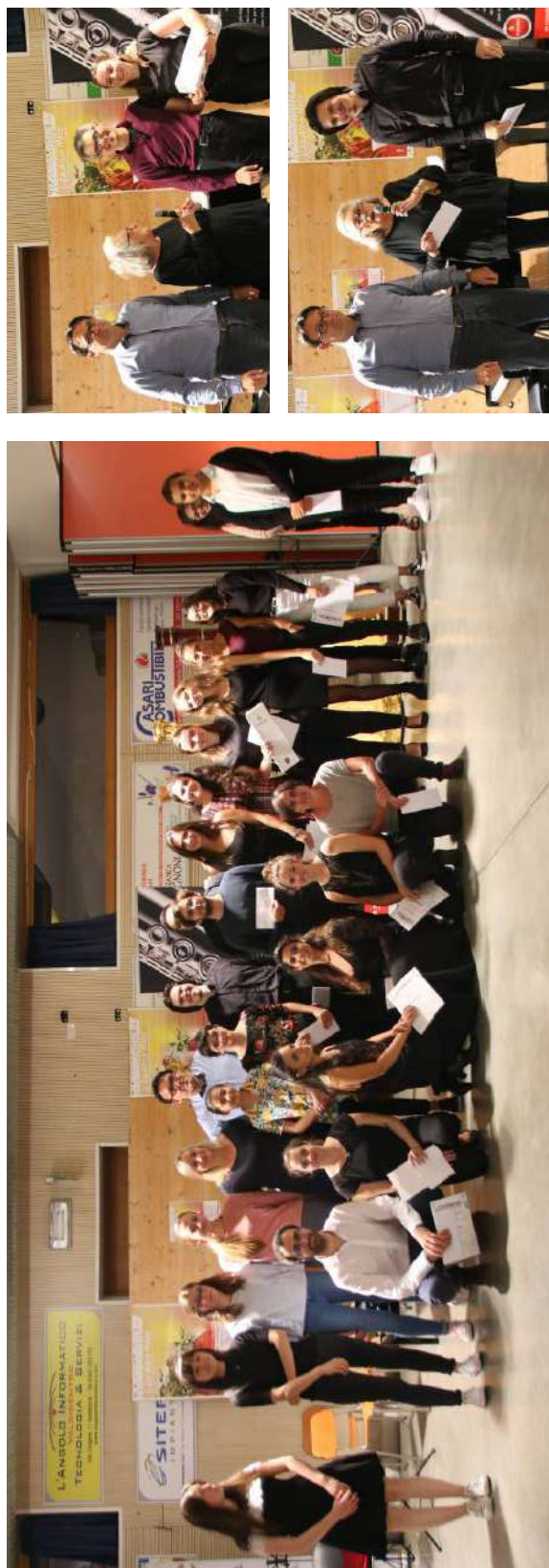
I ragazzi premiati al termine dei corsi e dei seminari compresi nel Festival Le Altre Note che si avvia alla conclusione

VALIDENTRO Il concerto «Gran soirée» è stato tenuto dai migliori tra i 114 allievi da tutto il mondo impegnati in 14 corsi tra corsi e seminari Le Altre Note, ecco tutti i ragazzi premiati Così l'assessore Ivano Schivalocchi: «Ho toccato con mano il valore complessivo dell'evento; orgoglioso della presenza di questo Festival»