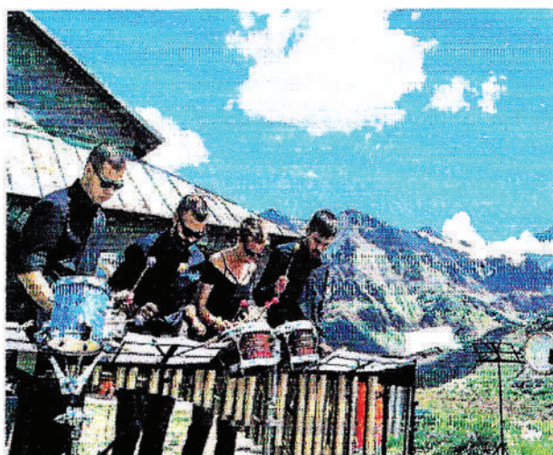
Un'esibizione dello scorso anno.