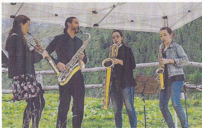
Le "Note Saxy" si sono propagate all'alpe Boron in Valdidentro e alla terrazza Livrio dello Stelvio