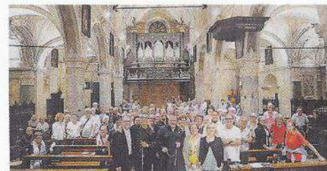
I protagonisti del concerto in Sant'Eufemia a Teglio