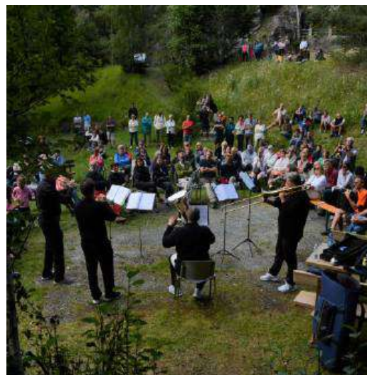
Concerto a Campo Franscia