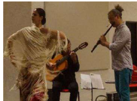
Alcuni momenti della conferenza stampa di presentazione di lunedì presso la Comunità montana di Sondrio