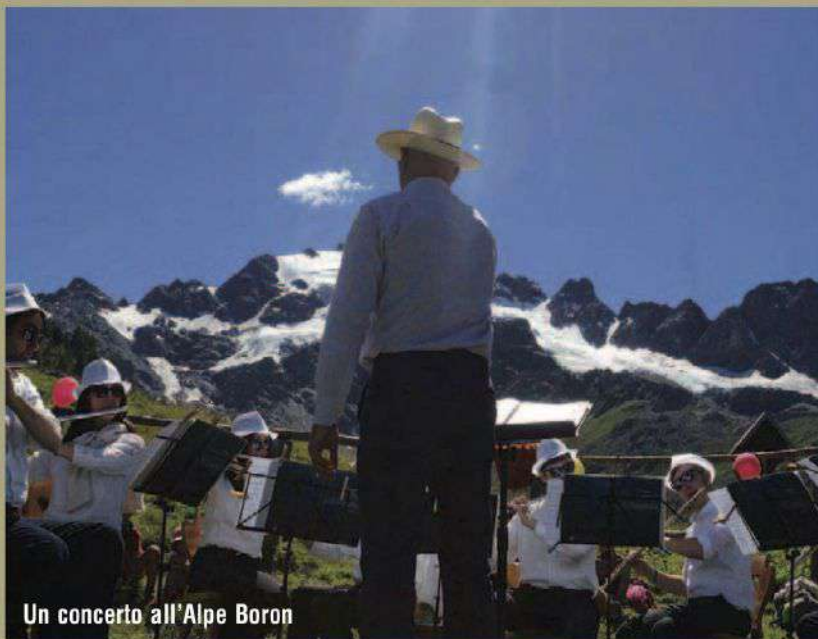
Un concerto all'Alpe Boron