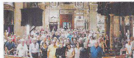
Un trionfo anche l'esibizione alla Basilica della Madonna di Tirano