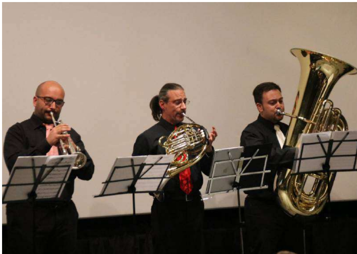
L'Ensemble di Ottoni (tromba, flicorno, trombone, corno, tuba) dell'Orchestra Fiati di Valle Camonica l'altra sera alle Terme

VALDIDENTRO Diciassette i concerti già proposti dall'evento dei fratelli Parrino