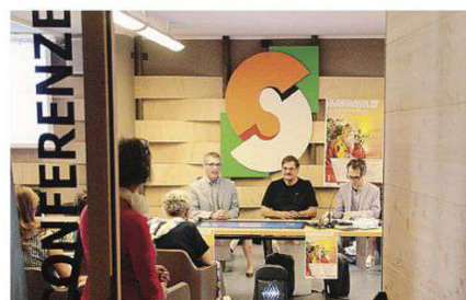
La sala della Comunità montana dove si è tenuta la presentazione