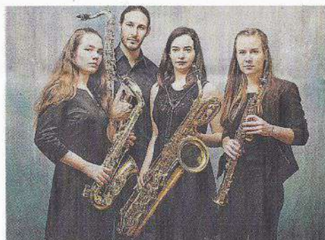
Il Mestizo Saxophone quartet