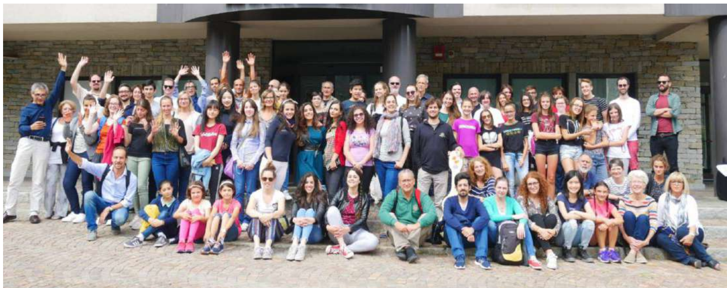
Docenti e allievi della Masterclass, che raduna ragazzi da tutto il mondo impegnati in 14 classi tra corsi e seminari

La Masterclass abbinata al Festival raduna ragazzi da tutto il mondo impegnati in 14 classi tra corsi e seminari