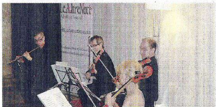
Il quartetto Viotti in concerto