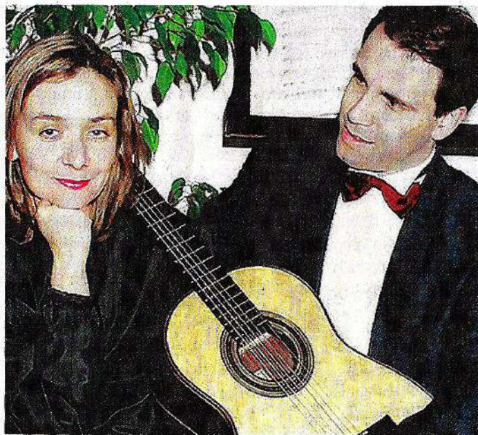
Il Duo Waldner si esibirà mercoledì a Cepina

valsi sposterà alla Villa Vesconti Venosta di Grosio dove, alle 21, sarà di scena l'orchestra sinfonica Rossini di Pesaro diretta da Giuseppe Grazioli, un graditissimo ritorno in Valtellina, con la partecipazione della cantante Cinzia Guareschi e del bandoneonista Davide Vendramin. Nell'originale programma della serata l'orchestra, che ha al suo attivo la presenza a numerosi festival e stagioni concertistiche con tournée in Europa e in Asia, presenta un eclettico incontro artistico, sullo sfondo di un paesaggio musicale che si snoda dai seducenti ritmi d'oltreoceano alle emozioni della contemporaneità italiana. Nella prima parte della scaletta è protagonista la musica di Astor Piazzolla con brani tratti da "María de Buenos Aires", opera tango del grande musicista e compositore argentino su testo del poeta uruguayano Horacio Ferrer, e con le "Cuatro estaciones Porteñas" rivisitate in formazione