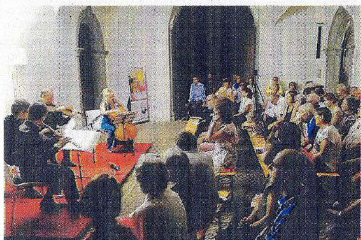
Un momento dell'esibizione a Palazzo Homodei di Sernio