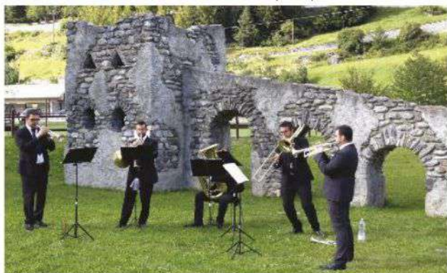
In alto: le percussioni del Conservatorio di Como al Passo Gavia. Di fianco: il quintetto di ottoni Dalam Kasus Brass in Valdidentro. In basso: l'immagine dell'edizione 2019 del Valtellina Festival.

di dislivello tra il concerto più basso e quello più in alta quota