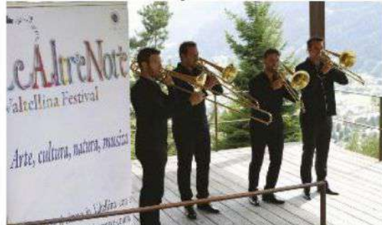
Bormio, Giardino Botanico del Parco Nazionale dello Stelvio: il Mascoulisse Quartet