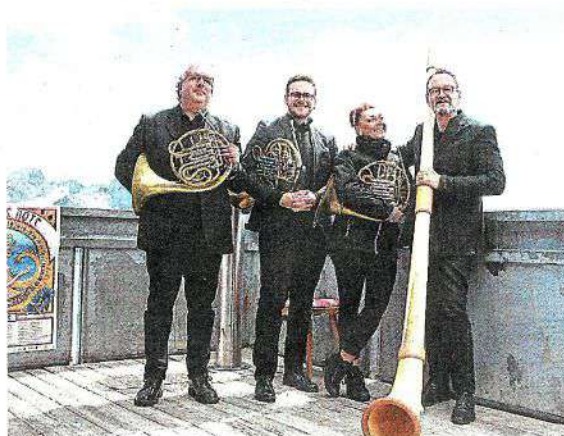
DA APPLAUSI Grandi musicisti in Valtellina e Valchiavenna