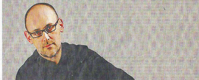
L'ensemble “L'arte dell'arco” presenterà “Senza de ti mia cara, nò che no posso star”