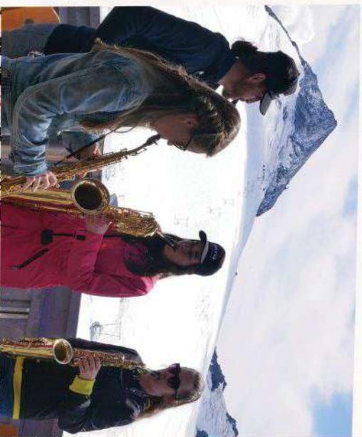
Il Mestizo Saxophone Quartet che si è esibito il 14 agosto allo Stelvio