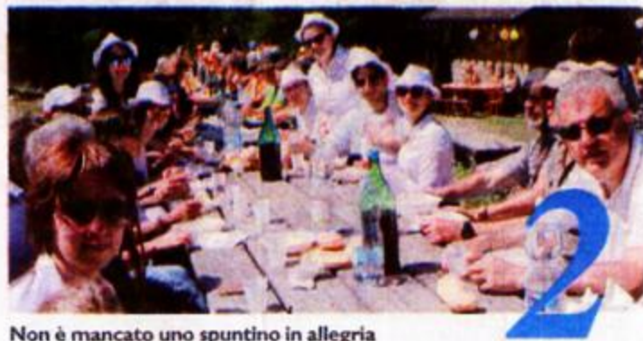
Non è mancato uno spuntino in allegria