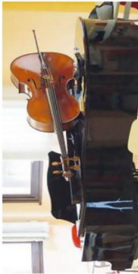
CLASSICA DOC Un piano e un violoncello, simboli della buona musica

■ Anche quest'anno la musica sale di quota e invita chiunque ne voglia assaporare la bellezza ad indossare scarpe comode e a preparare lo zaino. Dal 4 agosto all'11 settembre, infatti, la Valtellina si appresta ad accogliere nuovamente la festosa ciurma di artisti, allievi, ascoltatori, che risponderanno alla chiamata de "LeAltreNote". Settima edizione di una formula quanto mai azzeccata in cui la masterclass si sposa al Festival, la rassegna, nata con l'intento di consentire alle giovani generazioni di musicisti di confrontarsi e condividere esperienze, vede quest'anno a tema il motto "Playing youth: giochi sonori": un'idea dichiaratamente esplorativa della musica come territorio di incontro e di divertimento nella sua più nobile accezione, di gioia, di espressione di sé. A inaugurare