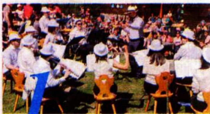
Sole battente e obbligo di protezione in testa