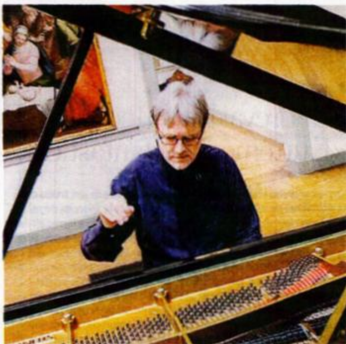
Massimo Viazzo si esibirà dopo Ferragosto