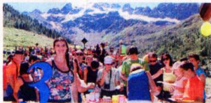
Circondati da una natura davvero maestosa