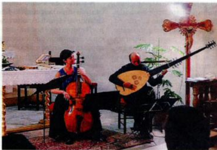
Un momento del concerto di lunedì nella chiesa di San Gallo