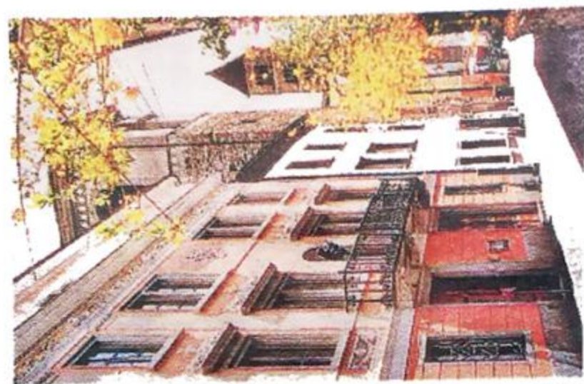
L'ingresso di Casa Console