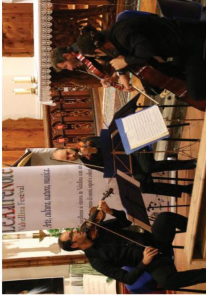
Una delle esibizioni del festival Le Altre Note

BORMIO (cvb) Il festival Le Altre Note «Playing Youth Giochi Sonori» che risuona in tutta la Valtellina (e Svizzera) è entrato nel pieno del suo vigore. I concerti del 6, 8, 9, 11 e 12, tenuti nelle chiese di San Giorgio a Grosio, San Gallo in Valdidentro, Sant'Eufemia a Teglio (ripetuto alla casa del parco in Valfurva) sono stati molto apprezzati. L'ensemble La Selva ha presentato un affascinante programma di musica antica ispirato ai Tarocchi del Mantegna che prevedeva interventi attivi del pubblico nella scelta delle composizioni estratte dalle carte da gioco. Il secondo ha visto la performance del celebre Quartetto Viotti impegnato nell'interpretazione