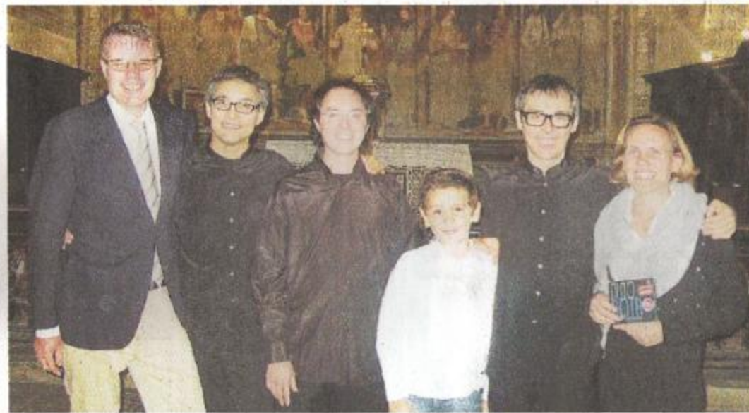
Un'immagine dell'edizione 2011 della rassegna Le Altre Note