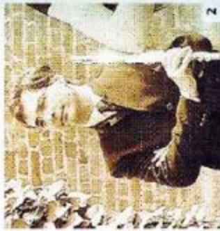
Alta Valle, che musical