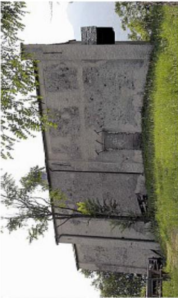
Le origini della chiesetta di San Bartolomeo risalgono tra il 1400 e il 1500

La chiesa, purtroppo, è stata oggetto di gravi episodi vandalici; è stata profanata e saccheggiata (altare settecentesco e acquasantiera del Seicento) ed è minacciata dalla natura insidiosa che tende ad ostruire l'accesso, ma resiste agli assalti del tempo e dell'uomo.