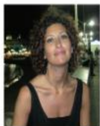
pagina a cura di Elide Bergamaschi