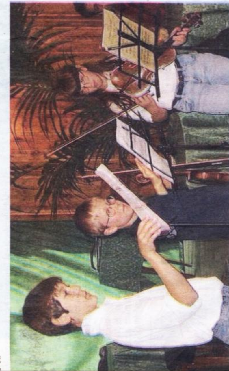
Alcuni piccoli allievi mentre partecipano al Masterclass del Festival Le Altre Note, in corso in questi giorni in Alta Valtellina